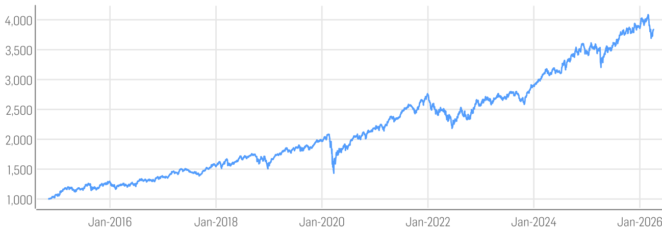
■ Solactive Wealthsimple North America Socially Responsible Factor Index NTR