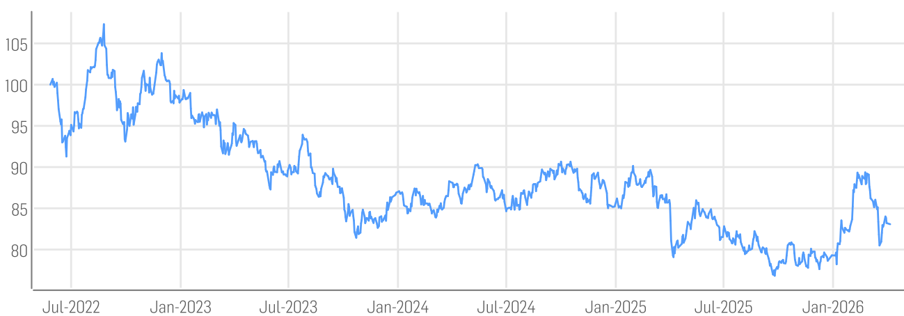
■ Börse Online Agrar und Nahrung Index